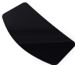
Mica interior oscura